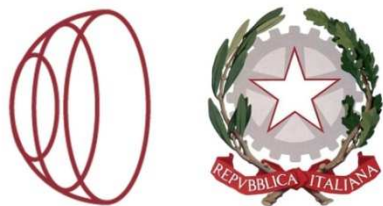
Conservatorio di Musica Licinio Refice di Frosinone Istituzione di Alta Cultura